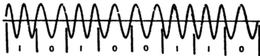
Gambar 6.1 Ilustrasi jawaban no. 1

Dengan menyatakan data logika “1” dengan frekuensi f_0 dan data logika “0” dengan f_1 , maka sinyal BFSK untuk arus data 10100110 dapat diilustrasikan sebagai berikut.