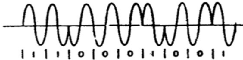
Gambar 6.2 Ilustrasi jawaban no. 2

Dengan menyatakan data logika “1” dengan fase 180^\circ dan data logika “0” dengan fase 0^\circ . Jenis modulasi ini berarti terjadinya perubahan fase sebesar 180^\circ setiap kali terjadi perubahan arus data dari logika “1” ke logika “0” atau sebaliknya. Dengan demikian maka sinyal BPSK untuk arus data 110001001 dapat diilustrasikan sebagai berikut.