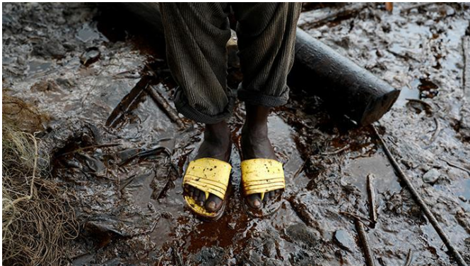
Gambar 1. Pencemaran tanah akibat tumpahan minyak bumi Nigeria

Kasus pencemaran tanah pada tahun 2004, terjadi kontroversi terkait pencemaran merkuri di Teluk Buyat, Sulawesi Utara, yang dihubungkan dengan kegiatan penambangan emas tanpa izin. Love Canal di Niagara Falls, New York, mengalami pencemaran tanah dan air karena pembuangan limbah kimia oleh perusahaan kimia Hooker Chemical. Kegiatan pengeboran minyak bumi di Nigeria telah menyebabkan pencemaran tanah yang signifikan karena tumpahan minyak di Nembe, Nigeria tahun 2021.