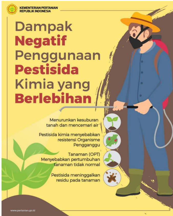
Gambar 2. Dampak Pestisida