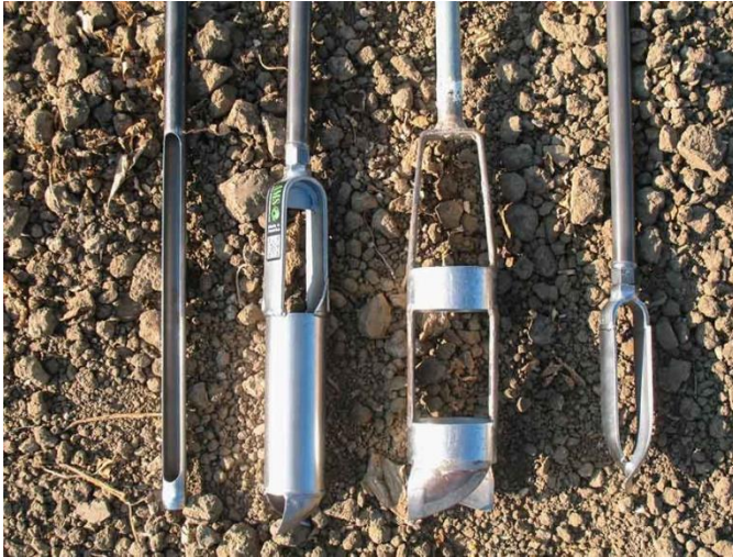
Gambar 3. Alat Pengambil Sampel Tanah