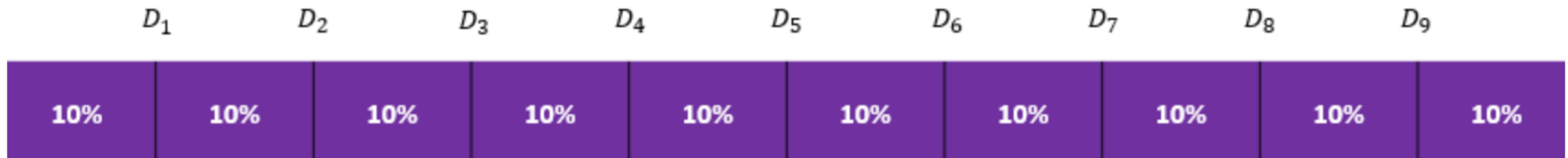
Penyebaran Data: Desil

Membagi data menjadi 10 bagian yang sama besar. Ada sembilan desil yang menunjukkan batas antara setiap bagian.