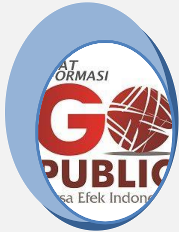
Biro Administrasi Efek

Mencatat dan memindahkan kepemilikan efek