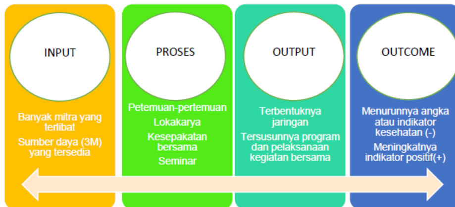
Gambar 4.3 Indikator Keberhasilan Kemitraan Bidang Kesehatan