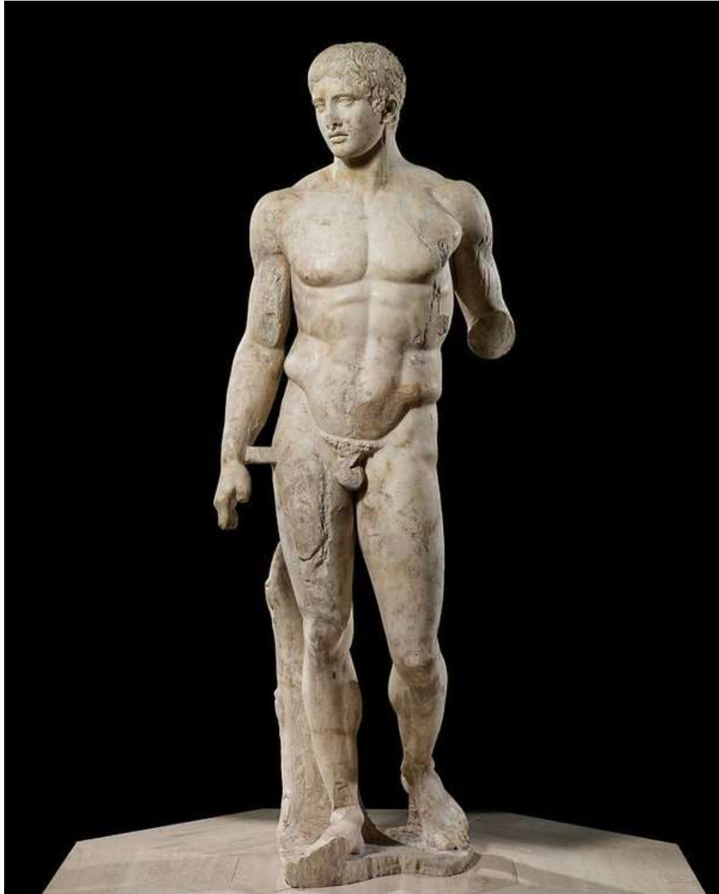
Doryphoros of Polykleitos Marbles copies of bronze original circa 440 BCE