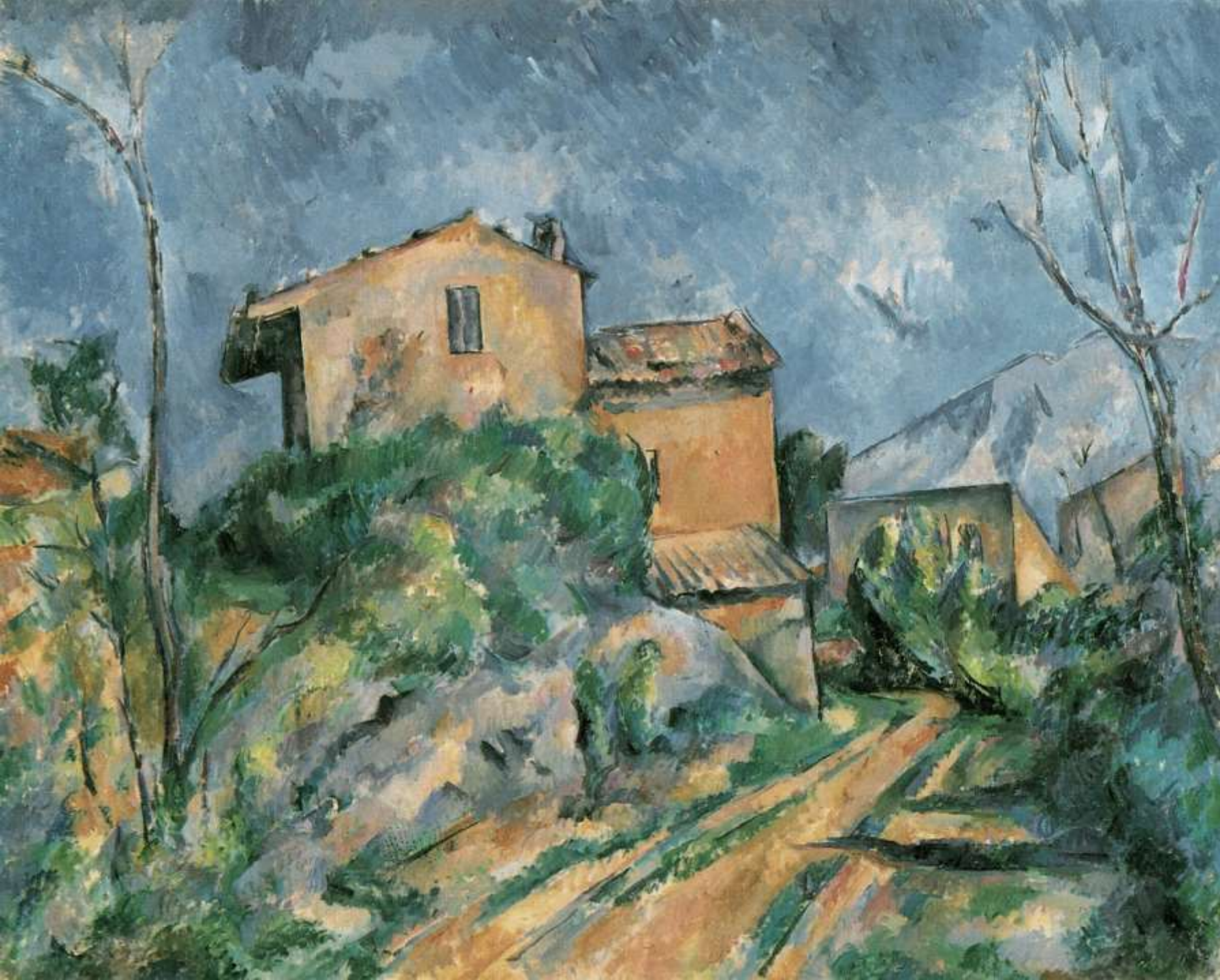
Paul Cézanne Maison Maria with a View of Château Noir Circa 1895 Kimbel Art Museum