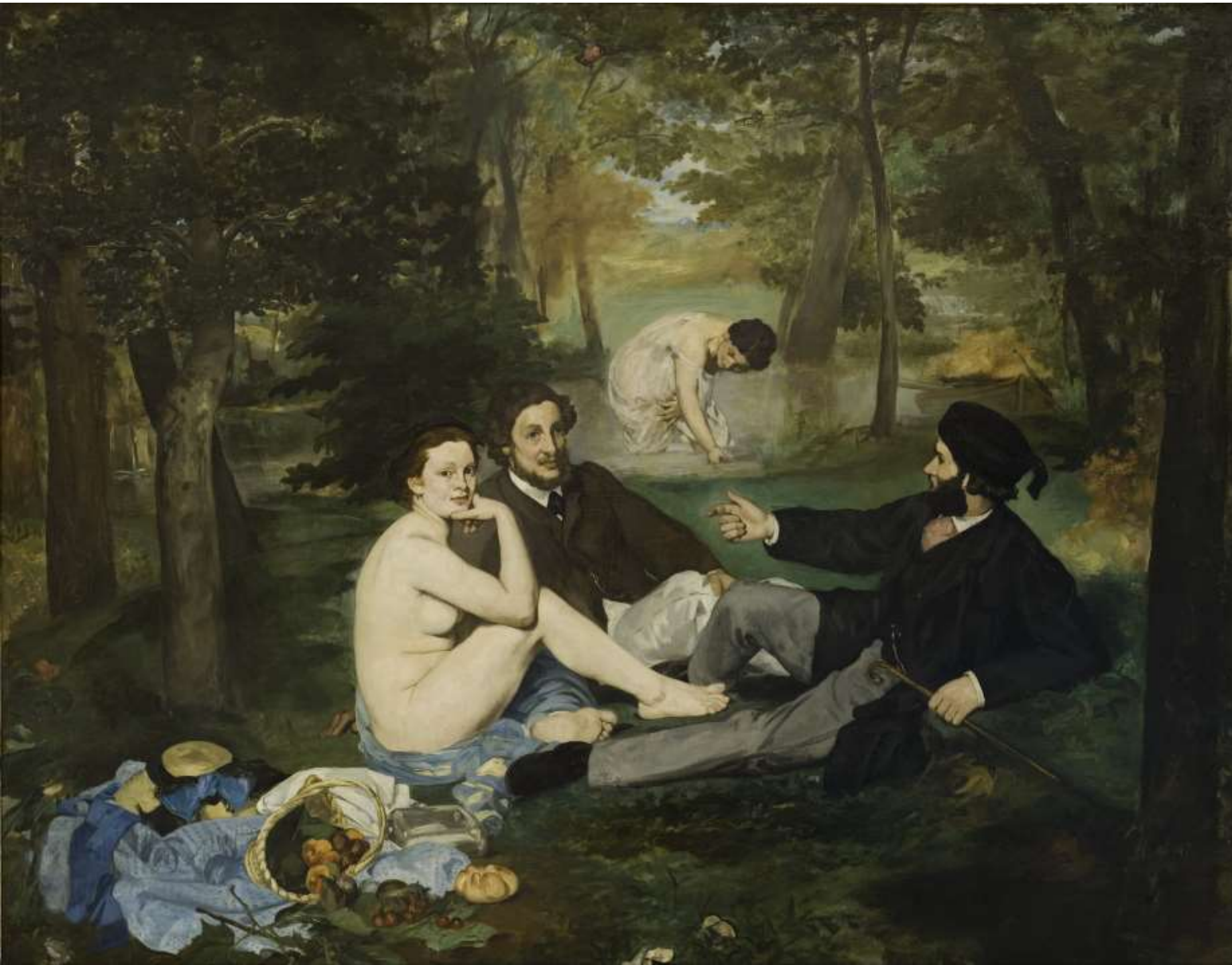
Édouard Manet The Luncheon on the Grass (Le déjeuner sur l'herbe) 1863 Musée d'Orsay, France