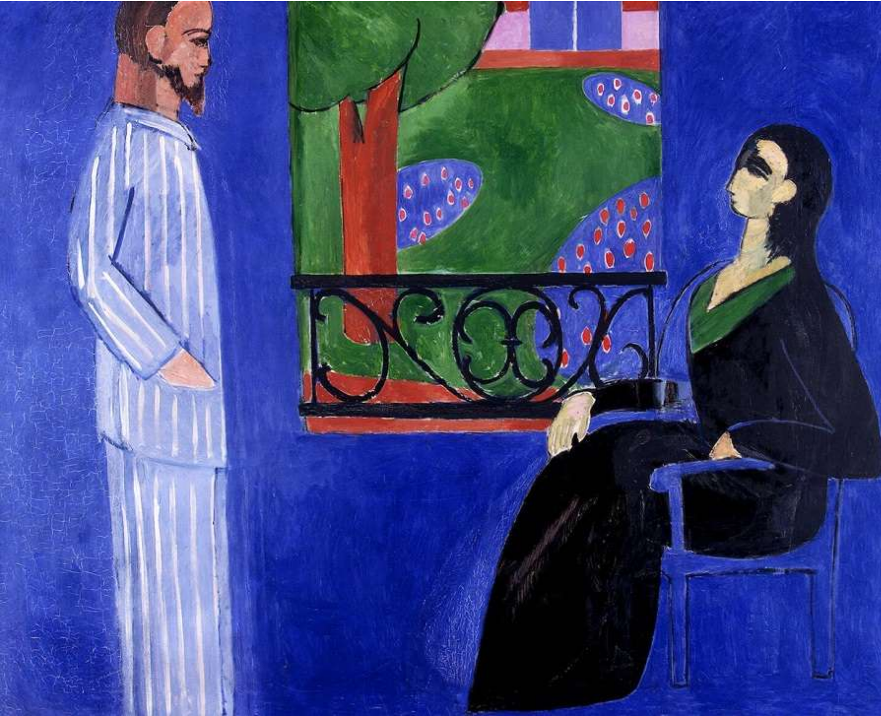
Henri Matisse La Conversation 1909