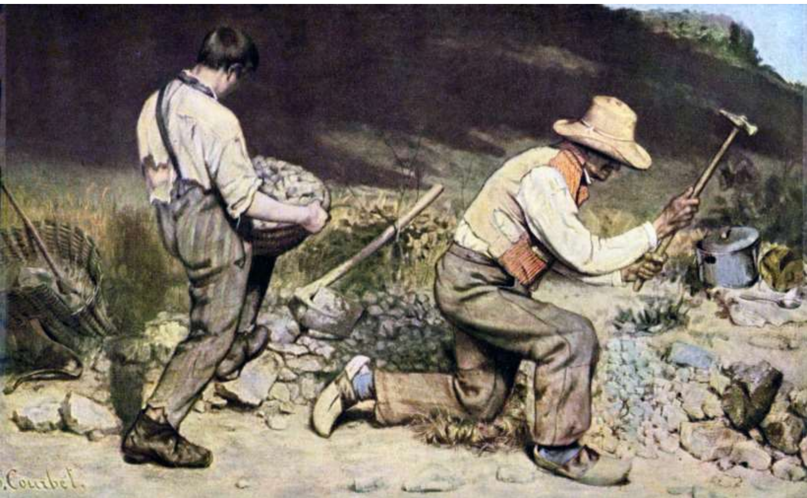
Gustave Courbet The Stone Breakers 1849 Destroyed During WW II