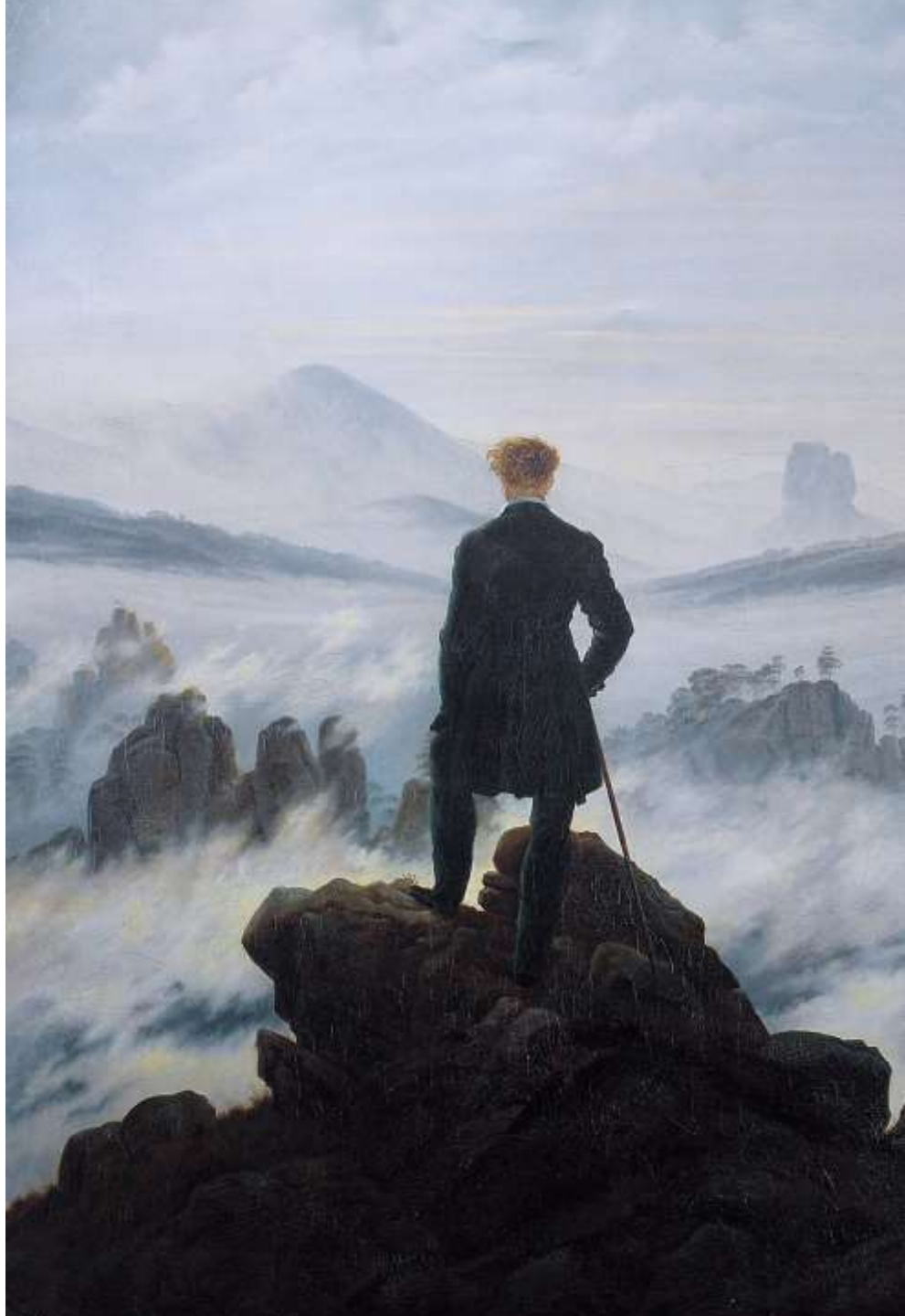
Caspar David Friedrich Der Wanderer über dem Nebelmeer ( The wanderer above the sea of fog ) Circa 1817 Hamburger Kunsthalle