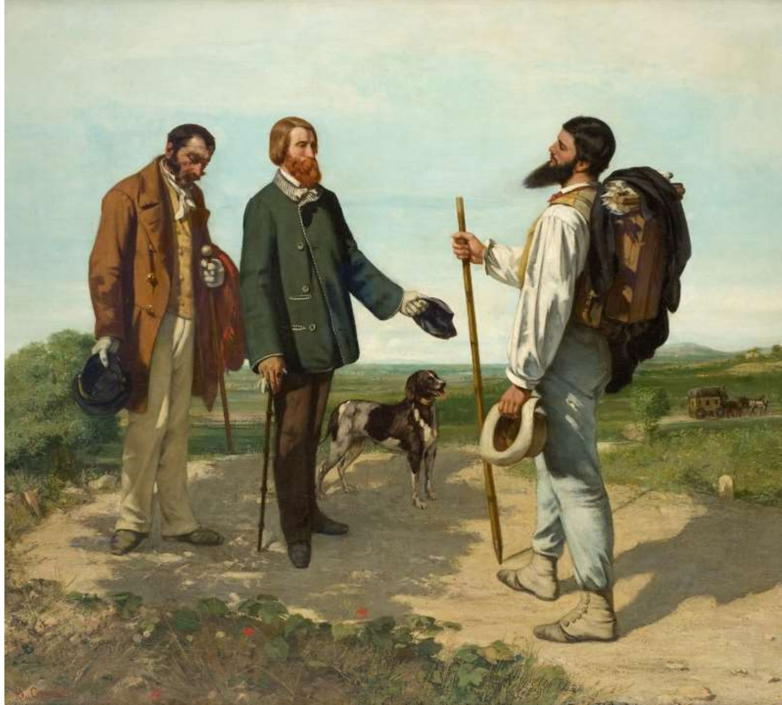
Gustave Courbet The Meeting ("Bonjour, Monsieur Courbet") 1854 Musée Fabre, Montpellier