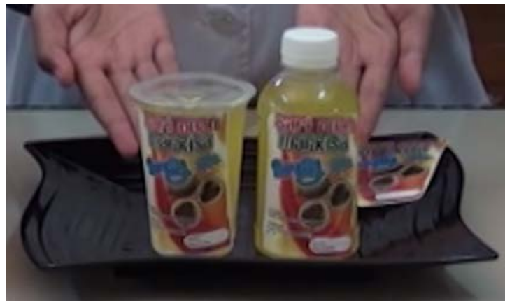
Gambar 33. Minuman Sari Markisa