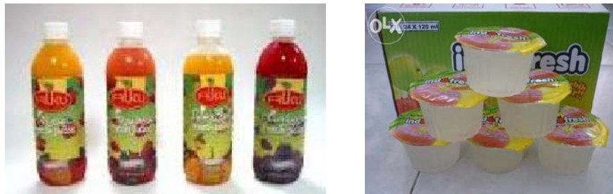
Gambar 32. Kemasan Minuman Sari Buah

Pengemasan sari buah dapat dilakukan dengan botol kaca, botol plastik atau gelas plastik.