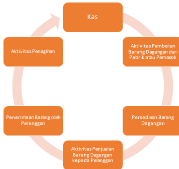
Gambar 4.2. Siklus Kegiatan Perusahaan Dagang

Siklus aktivitas perusahaan dagang dimulai dari pengeluaran uang dan berakhir dengan menerima uang dari pelanggan.