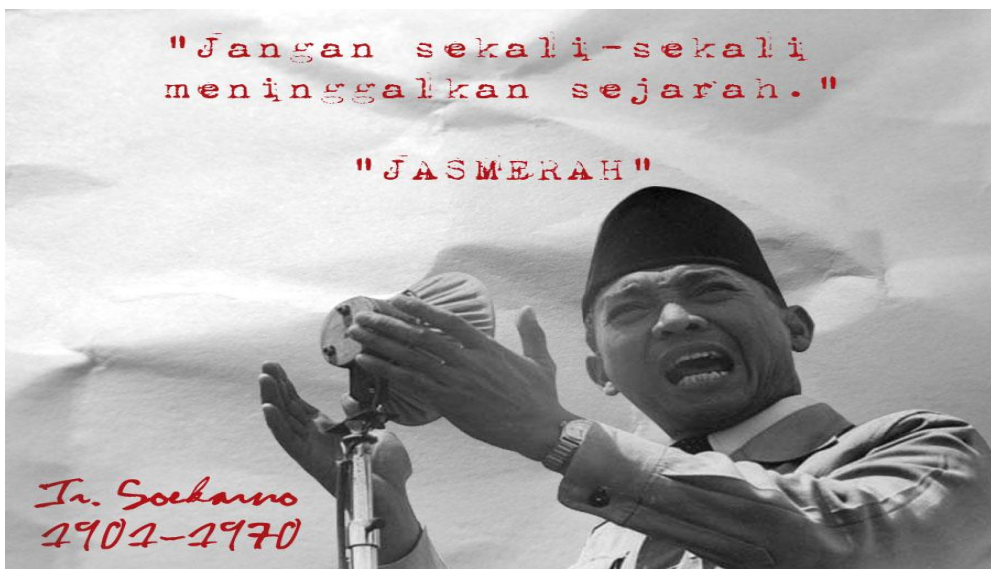
Gambar 1.6: Pidato Presiden Soekarno

Magistra ”, yang bermakna, “Sejarah memberikan kearifan”. Pengertian lain dari istilah tersebut yang sudah menjadi pendapat umum ( common-sense ) adalah “Sejarah merupakan guru kehidupan”. Implikasinya, pengayaan materi perkuliahan Pancasila melalui pendekatan historis adalah amat penting dan tidak boleh dianggap remeh guna mewujudkan kejayaan bangsa di kemudian hari. Melalui pendekatan ini, mahasiswa diharapkan dapat mengambil pelajaran atau hikmah dari berbagai peristiwa sejarah, baik sejarah nasional maupun sejarah bangsa-bangsa lain. Dengan pendekatan historis, Anda diharapkan akan memperoleh inspirasi untuk berpartisipasi dalam pembangunan bangsa sesuai dengan program studi masing-masing. Selain itu, Anda juga dapat berperan serta secara aktif dan arif dalam berbagai kehidupan berbangsa dan bernegara, serta dapat berusaha menghindari perilaku yang bernuansa mengulangi kembali kesalahan sejarah.