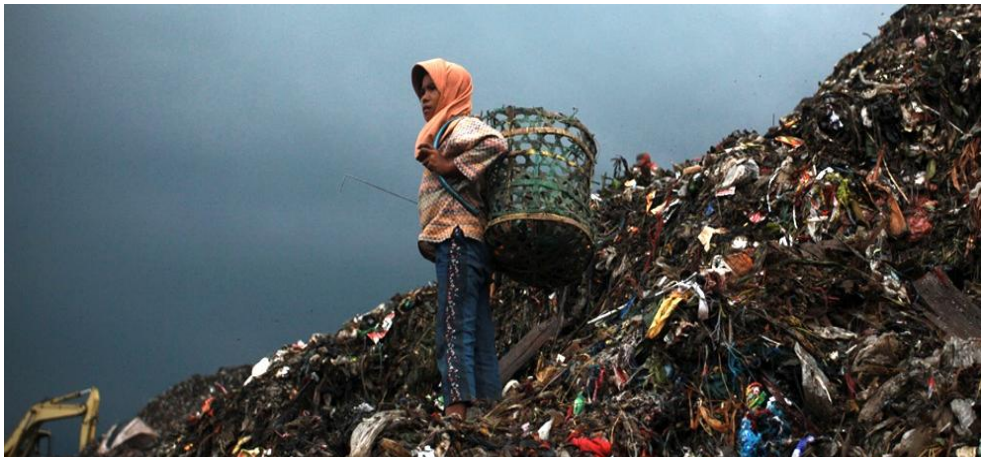
Gambar 1.4 Gunung Sampah di Bantar Gebang

Selain masalah hutan, masalah keseharian yang dihadapi masyarakat Indonesia saat ini adalah sampah, pembangunan yang tidak memperhatikan ANDAL dan AMDAL, polusi yang diakibatkan pabrik dan kendaraan yang semakin banyak. Hal tersebut menunjukkan bahwa kesadaran masyarakat terhadap kelestarian lingkungan masih perlu ditingkatkan. Peningkatan kesadaran lingkungan tersebut juga merupakan perhatian pendidikan Pancasila.