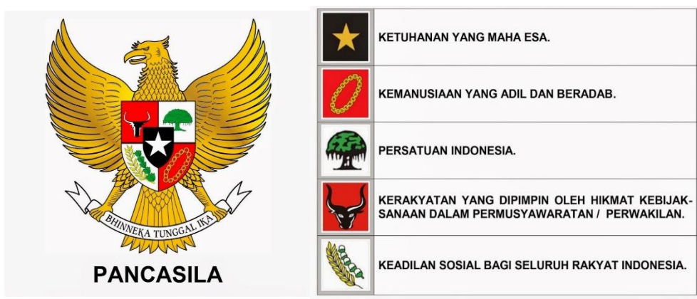
Gambar 1.0 Pancasila sebagai dasar NKRI

Pada bagian pengantar ini, Anda akan diajak untuk memahami konsep, hakikat, dan perjalanan pendidikan Pancasila di Indonesia. Hal tersebut penting untuk diketahui karena berlakunya pendidikan Pancasila di perguruan tinggi mengalami pasang surut. Selain itu, kebijakan penyelenggaraan pendidikan Pancasila di perguruan tinggi tidak serta merta diimplementasikan baik di perguruan tinggi negeri maupun di perguruan tinggi swasta. Keadaan tersebut terjadi karena dasar hukum yang mengatur berlakunya pendidikan Pancasila di perguruan tinggi selalu mengalami perubahan dan persepsi pengembang kurikulum di masing-masing perguruan tinggi berganti-ganti. Lahirnya ketentuan dalam pasal 35 ayat (5) Undang-Undang Nomor 12 Tahun 2012 yang menyatakan bahwa kurikulum pendidikan tinggi wajib memuat mata kuliah agama, Pancasila, kewarganegaraan, dan bahasa Indonesia menunjukkan bahwa negara berkehendak agar pendidikan Pancasila dilaksanakan dan wajib dimuat dalam kurikulum perguruan tinggi sebagai mata kuliah yang berdiri sendiri. Dengan demikian, mata kuliah Pancasila dapat lebih fokus dalam membina pemahaman dan penghayatan mahasiswa mengenai ideologi bangsa Indonesia. Hal tersebut berarti pendidikan