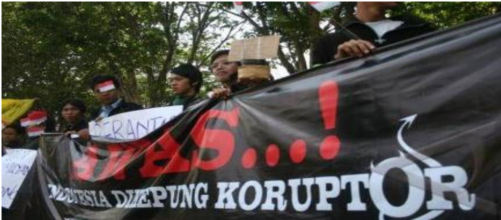
Gambar I.2: Unjuk rasa mahasiswa menentang korupsi

Masalah korupsi sampai sekarang masih banyak terjadi, baik di pusat maupun di daerah. Transparency Internasional (TI) merilis situasi korupsi di 188 negara untuk tahun 2015. Berdasarkan data dari TI tersebut, Indonesia masih menduduki peringkat 88 dalam urutan negara paling korup di dunia.