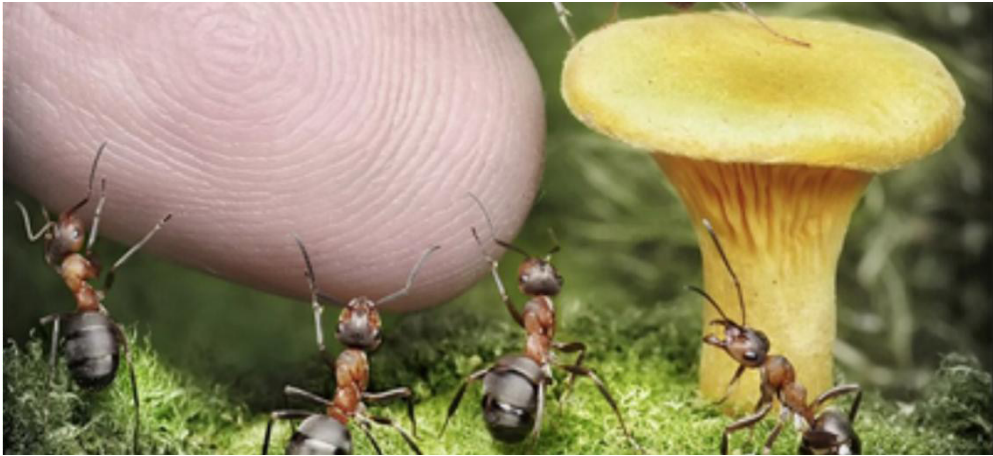
Gambar 1.1 Gotong royong sebagai salah satu nilai dalam Pancasila. Berat sama dipikul ringan sama dijinjing.

kebangsaan Republik Indonesia, maka penyimpangan terhadap nilai-nilai Pancasila dapat berakibat terancamnya kelangsungan negara.