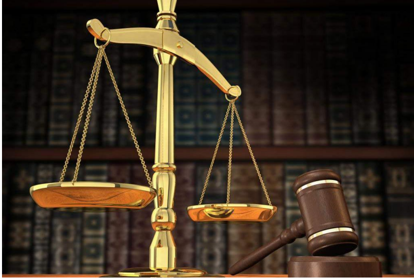
Gambar 1.4: Simbol hukum

Salah satu tujuan dari gerakan reformasi adalah mereformasi sistem hukum dan sekaligus meningkatkan kualitas penegakan hukum. Memang banyak faktor yang berpengaruh terhadap efektivitas penegakan hukum, tetapi faktor dominan dalam penegakan hukum adalah faktor manusianya. Konkretnya penegakan hukum ditentukan oleh kesadaran hukum masyarakat dan profesionalitas aparaturnya. Inilah salah satu urgensi mata kuliah pendidikan Pancasila, yaitu meningkatkan kesadaran hukum para mahasiswa sebagai calon pemimpin bangsa.