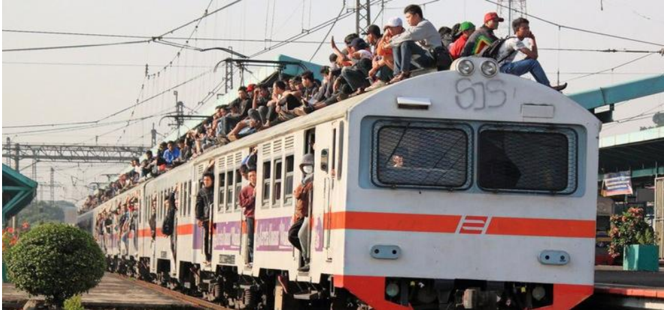
Gambar I.1: Free rider , menikmati manfaat pembangunan tanpa berkontribusi melalui pajak. Hal ini diibaratkan seperti penumpang kereta api yang tidak membeli tiket tetapi menikmati manfaat transportasi tersebut (Sumber: http://kp2kpngabang.blogspot.co.id/2013/09/jangan-menjadi-free-rider-di-atas-roda.html )