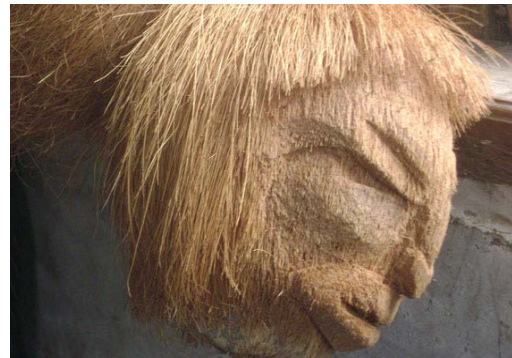
Gambar 9. Karya dari batok kelapa