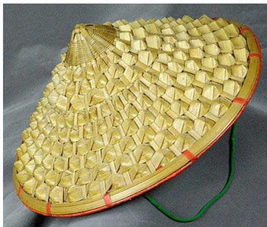
Gambar 4. Karya seni dari daun lontar