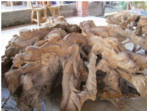
Gambar 8. Karya dari akar jati