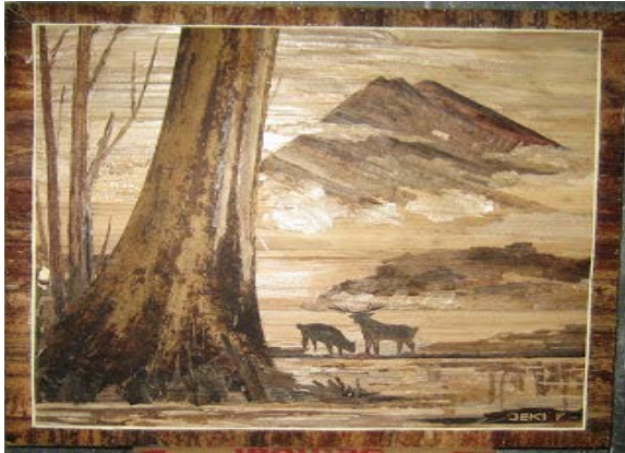
Gambar 6. Karya dari pelepah pisang