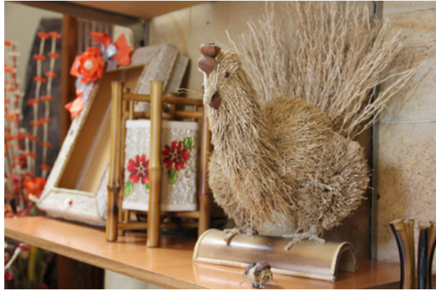
Gambar 7. Karya dari akar wangi