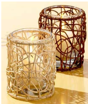
Gambar 1. Karya dari kayu rotan