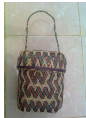
Gambar 3. Karya dari bambu