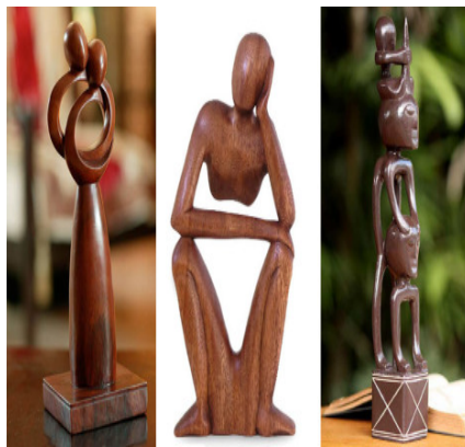
Gambar 2. Karya dari kayu jati