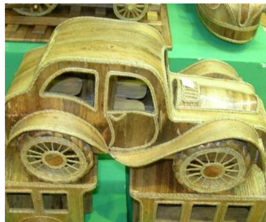
Gambar 5. Karya dari eceng gondok