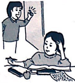
刚才我去她宿舍的时候,她正在学习呢。