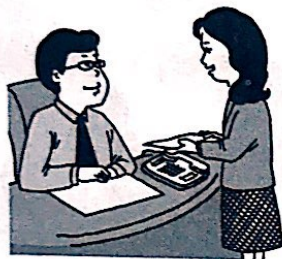
她最近在找工作呢。