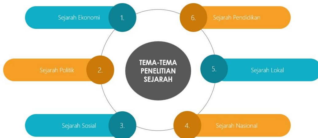
Gambar 3. Tema-tema dalam penelitian sejarah

Tema-tema dalam penulisan sejarah antara lain sejarah ekonomi, sejarah politik, sejarah sosial, sejarah nasional, sejarah lokal, sejarah pendidikan dan lain sebagainya. Tema-tema sejarah tersebut memiliki konsep-konsep tersendiri yang membedakan antara yang satu dengan yang lainnya. Mari kita melakukan identifikasi dari berbagai tema-tema sejarah yang membentang luas, membawa kita pada perjalanan melintasi rentang waktu dan keberagaman manusia.