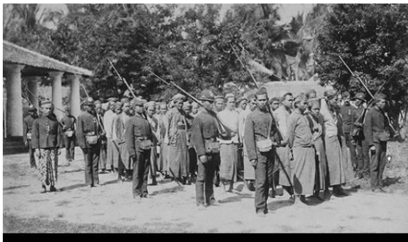
Gambar 4. "Pemberontakan Petani Banten 1888" sebagai contoh tema sejarah sosial

Tema sejarah sosial merangkum kajian terhadap interaksi, perubahan, dan dinamika dalam masyarakat pada masa lalu. Ini melibatkan pemahaman mendalam tentang struktur sosial, nilai-nilai, norma, hubungan antar individu, serta perubahan sosial yang memengaruhi kehidupan manusia dalam berbagai konteks (Rochmat, 2010). Sejarah melibatkan telaah tentang aktivitas manusia yang mencerminkan pemikiran, emosi, dan tindakan mereka pada masa lalu. Salah satu bentuk aktivitas manusia melibatkan dinamika kehidupan sosial. Aspek ini dapat dijadikan fokus dalam penyelidikan sejarah atau menjadi subyek dalam sejarah sosial.