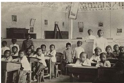
Gambar 6. “Kondisi pendidikan di Indonesia sebelum merdeka” sebagai contoh tema sejarah pendidikan

Tema-tema penelitian sejarah membentang luas dan memberikan pemahaman