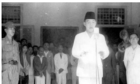
Gambar 5. Tema sejarah Nasional "Presiden Soekarno Memproklamkan Kemerdekaan Indonesia"

Tema sejarah nasional adalah penelitian yang menyoroti perjalanan sejarah suatu negara secara keseluruhan, menggali aspek-aspek politik, sosial, budaya, ekonomi, dan peristiwa penting yang membentuk identitas dan perkembangan nasional. Kajian ini merangkum narasi sejarah suatu bangsa dari masa prasejarah hingga masa kini, membantu memahami akar sejarah dan perkembangan peradaban dalam konteks nasional (Sukmana, 2021).