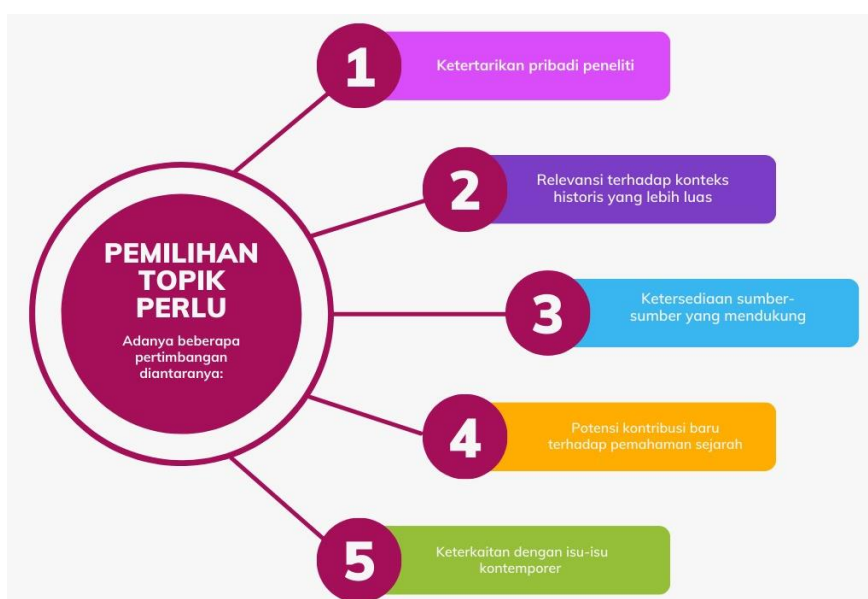
Gambar 1. Pemilihan topik sejarah

Pemilihan topik dalam penelitian sejarah melibatkan pertimbangan-pertimbangan seperti ketertarikan pribadi peneliti, relevansi terhadap konteks historis yang lebih luas, ketersediaan sumber-sumber yang mendukung, potensi kontribusi baru terhadap pemahaman sejarah, serta kaitan dengan isu-isu kontemporer atau pertanyaan-pertanyaan yang relevan (Albar & Fauzi, 2017). Pemilihan topik yang tepat akan membantu peneliti tetap fokus, terhindar dari topik yang terlalu luas atau tidak terkendali, dan menghasilkan penelitian yang informatif dan bermakna dalam memperdalam pemahaman tentang masa lalu.