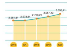
Penjualan Bersih Net Sales (miliar Rupiah | billion Rupiah)

Penjualan bersih terus tumbuh dengan CAGR 6,8% dalam 5 tahun terakhir. Net sales has consistently grew with a CAGR of 6.8% in the past 5 years.