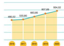
Laba Bersih Net Income (miliar Rupiah | billion Rupiah)

Laba tahun berjalan terus meningkat dengan CAGR 18,1% dalam 5 tahun terakhir. Profit for the year has consistently increased with a CAGR of 18.1% in the past 5 years.