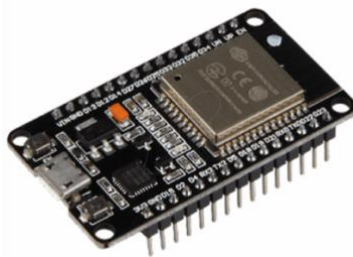
Gambar 5.3. NodeMCU ESP32

prosesor satu untuk menangani jaringan WiFi dan Bluetooth, dan satu lagi untuk menjalankan aplikasi. Modul ini dilengkapi dengan memori RAM yang cukup besar untuk menyimpan data. ESP32 memiliki fitur-fitur berguna seperti TCP/IP, HTTP, dan FTP. Modul ini juga mendukung pemrosesan sinyal analog, sensor, serta perangkat input/output digital. Perbedaan modul ESP32 dengan modul ESP8266 adalah ESP32 mendukung konektivitas Bluetooth, sehingga dapat digunakan untuk mengontrol perangkat yang terhubung melalui Bluetooth. ESP32 sangat cocok untuk implementasi Internet of Things (IoT) yang memerlukan konektivitas WiFi dan Bluetooth.