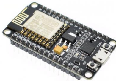
Gambar 5.2. NodeMCU ESP8266

mempunyai fitur WiFi dengan standar IEEE 802.11 b/g/n walaupun port I/O tidak sebanyak Arduino Uno. Untuk penggunaan yang lebih mudah, modul ESP8266 sudah terbangun pada satu board yaitu NodeMCU ESP8266. Pemrograman perangkat ini dapat menggunakan Arduino IDE atau MicroPython.