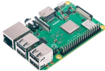
Gambar 5.4. Raspberry Pi

beda. Sehingga ketika diimplementasikan untuk IoT tentu bergantung juga pada kebutuhan.