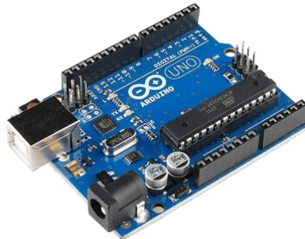
Gambar 5.1. Arduino Uno

Mikrokontroler pada Arduino menggunakan keluarga Atmel.