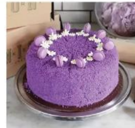
UBE VELVET CAKE 700./70.