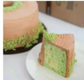
BOLU PANDAN CAKE 700./70.