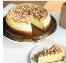
CLASSIC NEW YORK CHEESECAKE 750./75.