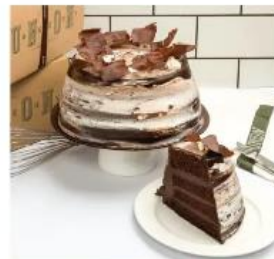
OLD FASHIONED CHOCOLATE CAKE 700./70.