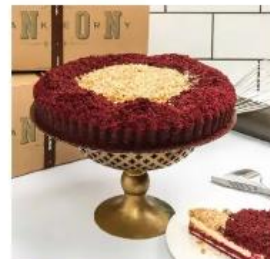
RED VELVET PIE 520./65.