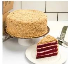
RED VELVET CAKE 750./75.