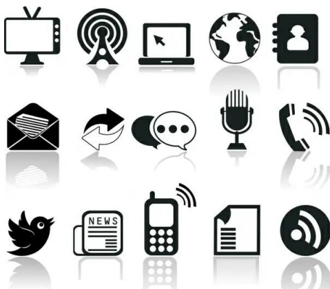
Gbr. 1. Ikon Komunikasi