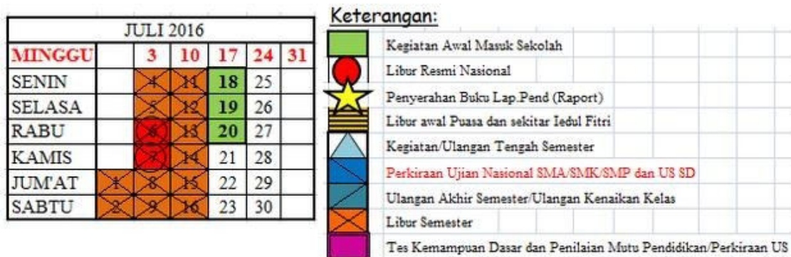
Gambar 1.1 Contoh kalender akademik

Di bawah ini contoh kasus yang sering dihadapi dalam menghitung pekan efektif dan tidak. Berikut ini proses menghitung pekan efektif di bulan Juli 2016 pada kalender Akademik.